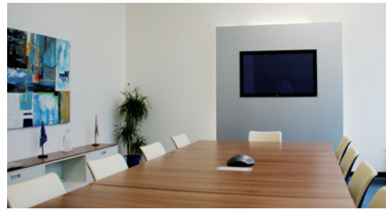
Konferenzraum der Firma Röhlig Deutschland GmbH & Co. KG

DAS HELIOS ist das architektonische Highlight im Munich Airport Business Park. Dieser innovative und expansive Standort bietet Ihnen entscheidende Vorteile: Die Nähe (25 Kilometer) zur Wirtschafts- und Kulturmetropole München und die unmittelbare Nähe (6 Kilometer) zum Flughafen München. Hinzu kommt die ausgezeichnete Verkehrsanbindung, sowohl an den MVV als auch an das gesamte Münchner Autobahnnetz.